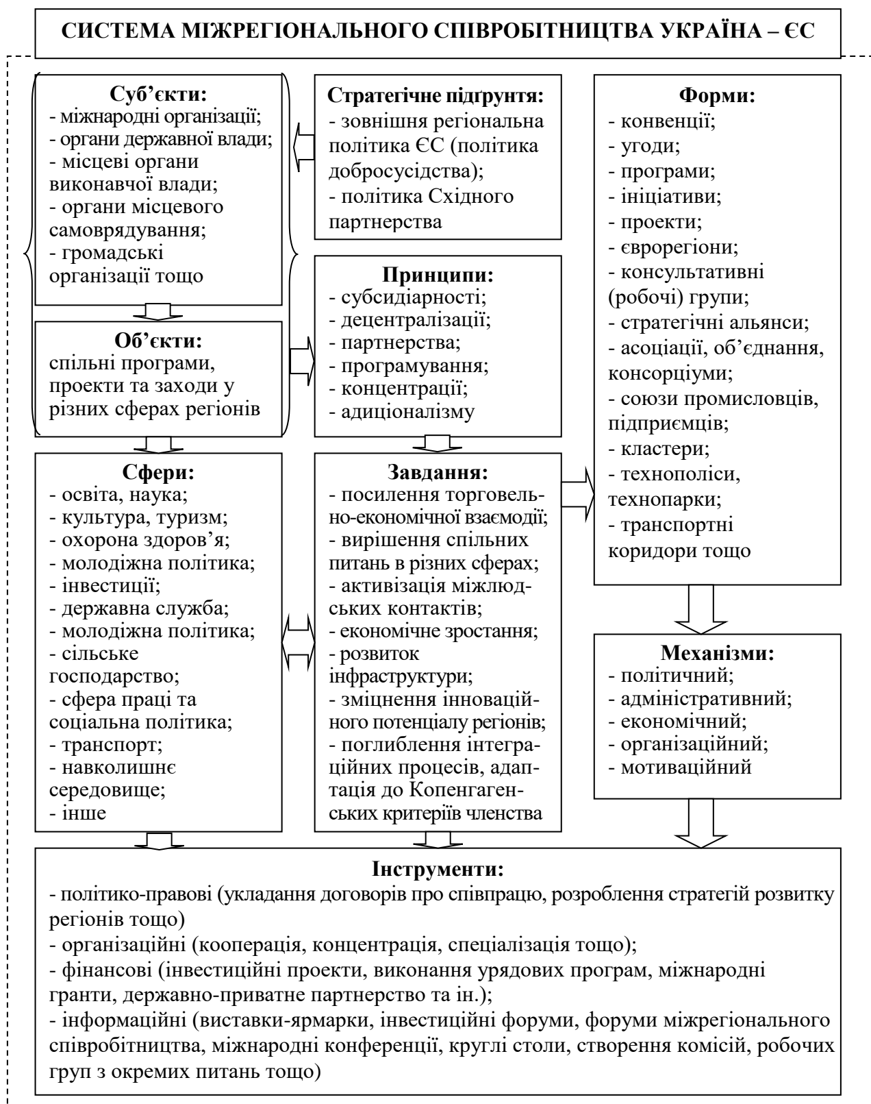
Рис. 1. Система міжрегіонального співробітництва Україна – ЄС (розробка авторів)