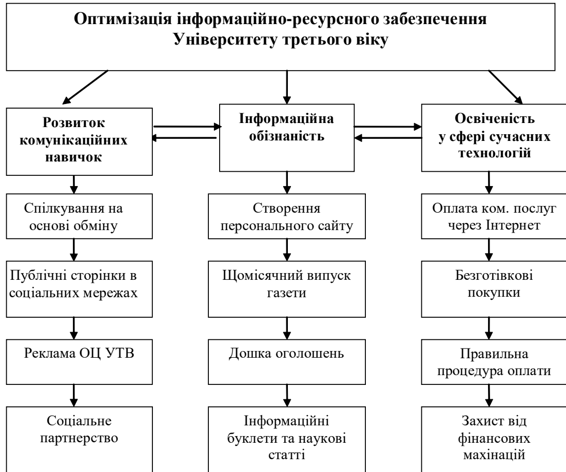
Рис. 1.1. Оптимізація інформаційно-ресурсного забезпечення Університету третього віку

інформаційно-ресурсного забезпечення ГО «Освітній Центр «Університет третього віку». Зобразимо це на рис. 1.1.