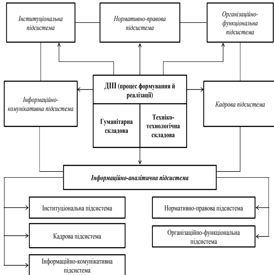
Рис. 2. Основні підсистеми процесу формування та реалізації державної інформаційної політики

інформаційно-аналітичною діяльністю, визначається специфікою діяльності органів державної влади, до яких вони належать, процес уніфікації органів ІАЗ має здійснюватися з урахуванням такої специфіки [12; 14].